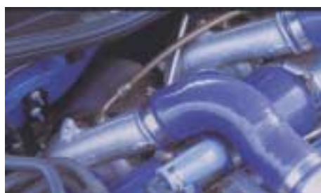
Stark gemacht: Zwei KKK K04Turbolader mit größeren Abgasgehäusen beflügeln die V6-Maschine