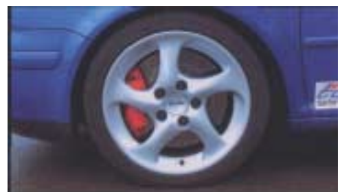
Halt gemacht: Für adäquate Verzögerung sorgen gelochte Scheiben mit 355mm Durchmesser und 996-Turbo-Sättel