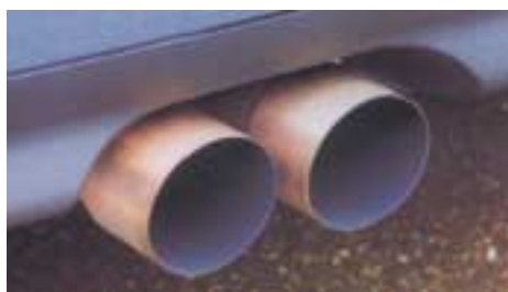
Dezent gemacht: Der dem Original ähnliche Doppelrohr-Auspuff hält sich sowohl akustisch als auch optisch zurück

Um aber erst mal vor diese Wahl gestellt zu sein, sollte man einen Golf V6 mitbringen dann wird der komplette Motor umgebaut inklusive Abgasanlage, Instrumenteneinheit, Einbau und TÜV. Zusätzlich wird eine obligatorische Bremsanlage fällig, die Spezial-Kupplung und noch Felgen, Reifen und Fahrwerk. Dann hat man aber einen absolut alltagstauglichen Supersportwagen. Und wo sonst gibt's das schon ?